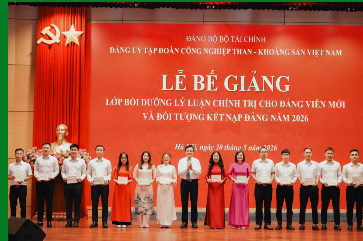
Trao Giấy chứng nhận cho các học viên lớp đảng viên mới và đối tượng kết nạp Đảng năm 2026