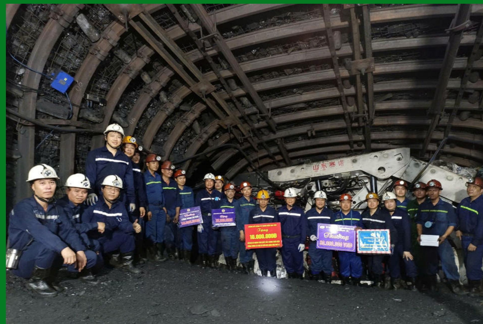
Lãnh đạo Công ty khen thưởng cho các đơn vị trực tiếp tham gia lắp đặt lò chợ