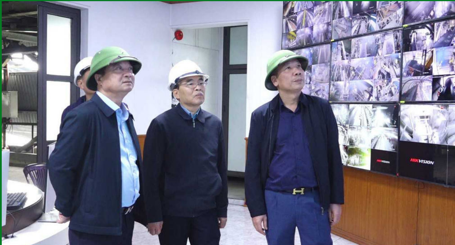
Lãnh đạo Công ty kiểm tra Trung tâm điều khiển sản xuất Phân xưởng Tuyển than 2

Đặc biệt, tại Nhà máy Tuyển than 2, dự án tự động hóa điều khiển tập trung đã được triển khai hoàn thiện vào năm 2025, cho phép chuyển đổi từ vận hành tại chỗ sang điều khiển tập trung, nâng cao năng suất và giảm thiểu rủi ro trong vận hành. Việc đẩy mạnh tự động hóa không chỉ là yêu cầu tất yếu trong quá trình hiện đại hóa sản xuất mà còn là giải pháp căn bản để nâng cao năng suất, đảm bảo an toàn và tối ưu hóa nguồn nhân lực.