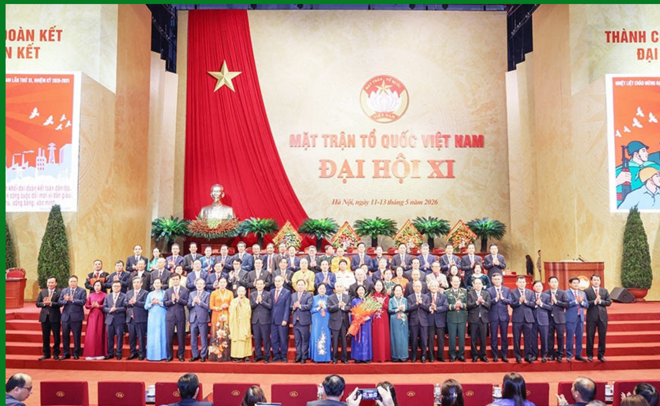
Đồng chí Võ Thị Ánh Xuân, Bí thư Trung ương Đảng, Phó Chủ tịch nước tặng hoa chúc mừng Đoàn Chủ tịch Ủy ban Trung ương Mặt trận Tổ quốc Việt Nam khóa XI

Thành công của Đại hội đại biểu toàn quốc Mặt trận Tổ quốc Việt Nam lần thứ XI là minh chứng sinh động, thể hiện sức mạnh của khối đại đoàn kết toàn dân tộc. Từ diễn đàn của đại hội hôm nay, Mặt trận Tổ quốc Việt Nam kêu gọi các tầng lớp nhân dân, đồng bào các dân tộc, tôn giáo, nhân sĩ, trí thức, văn nghệ sĩ, doanh nhân, đồng bào ta ở nước ngoài nêu cao tinh thần yêu nước, lòng tự hào dân tộc, tuyệt đối tin tưởng vào sự lãnh đạo của Đảng, Nhà nước; tích cực đóng góp trí tuệ, công sức, hăng say lao động, sản xuất, không ngừng củng cố, xây dựng, phát huy sức mạnh của khối đại đoàn kết toàn dân tộc, kết hợp với sức mạnh của thời đại, chung sức, đồng lòng xây dựng đất nước Việt Nam hòa bình, độc lập, dân chủ, giàu mạnh, phồn vinh, văn minh, hạnh phúc, vững bước đi lên chủ nghĩa xã hội.