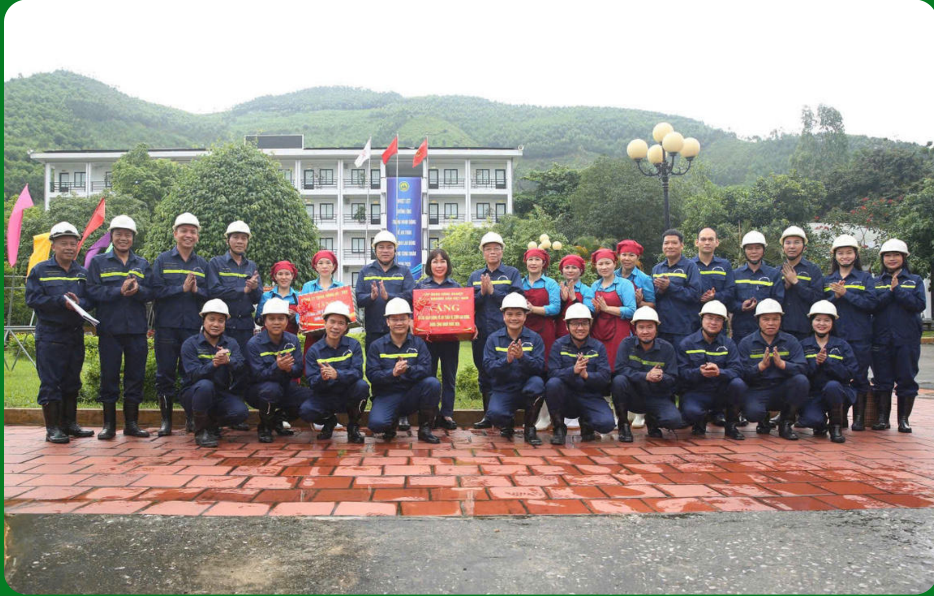
Trong chương trình, đoàn công tác cũng đã đến thăm khu tập thể công nhân Công ty tại khu 7, phường Vàng Danh và tặng quà, động viên cán bộ, công nhân Phân xưởng Đời sống phục vụ 1 - Đơn vị phục vụ ăn, tắm, giặt sấy và quản lý khu nhà ở cho người lao động tại khu tập thể Vàng Danh.