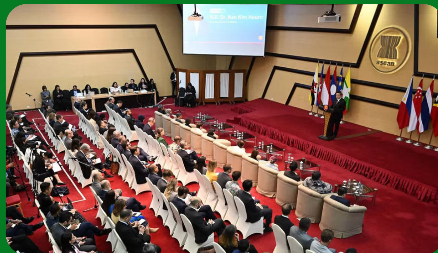
Quang cảnh lễ công bố kết quả hội nghị cấp cao ASEAN lần thứ 48 và các hội nghị liên quan

Bên cạnh đó, vấn đề an ninh lương thực cũng được đặt lên hàng đầu. ASEAN thống nhất duy trì thị trường mở, bảo đảm lưu thông hàng hóa thiết yếu và thúc đẩy phê chuẩn nhanh Nghị định thư nâng cấp Hiệp định Thương mại hàng hóa ASEAN (ATIGA 2.0).