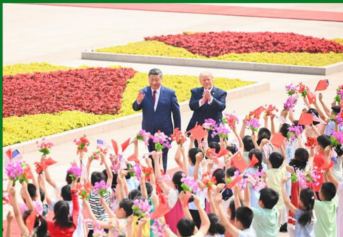
Chủ tịch Trung Quốc Tập Cận Bình đón tiếp Tổng thống Donald Trump tại thủ đô Bắc Kinh

Chuyến thăm cấp nhà nước tới Trung Quốc của Tổng thống Mỹ Donald Trump từ ngày 13 - 15/5/2026 được giới quan sát đánh giá là dấu mốc quan trọng trong nỗ lực hạ nhiệt căng thẳng và định hình lại quan hệ giữa hai nền kinh tế lớn nhất thế giới.