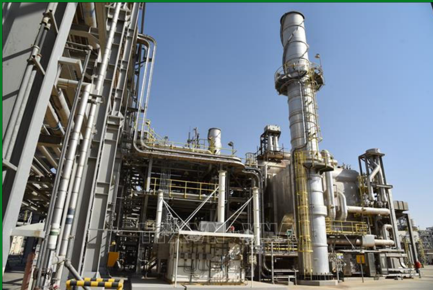
Một nhà máy lọc dầu ở Dammam, Saudi Arabia

Tổ chức Các nước xuất khẩu dầu mỏ (OPEC) vừa qua đã hạ dự báo tăng trưởng nhu cầu dầu toàn cầu năm 2026 trong bối cảnh xung đột liên quan Iran tiếp tục tác động mạnh đến thị trường năng lượng thế giới.