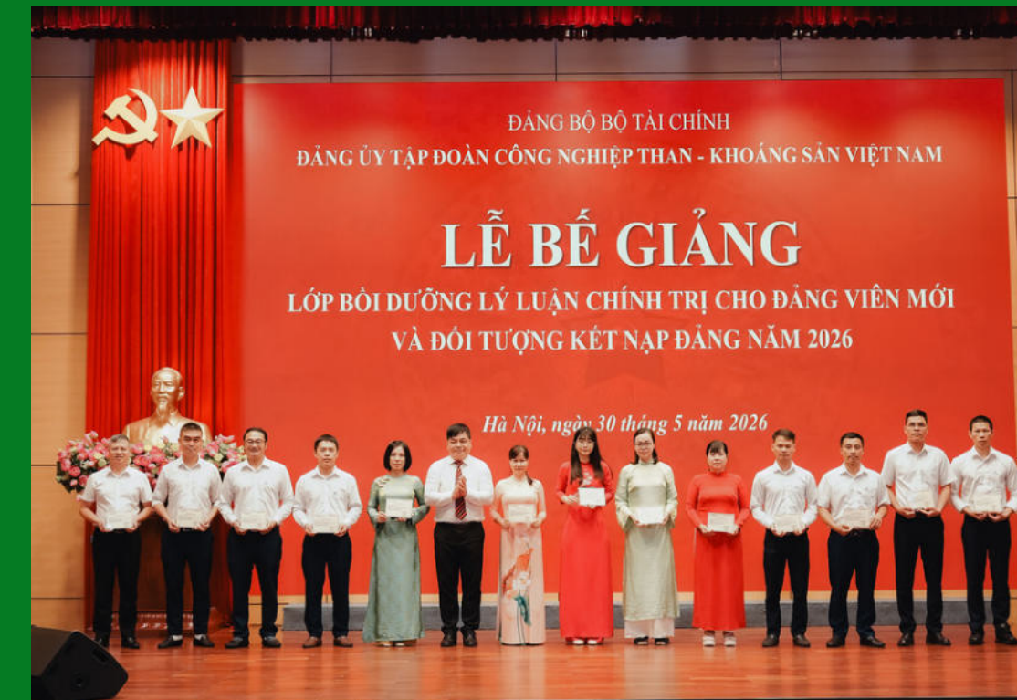
Trao Giấy chứng nhận cho các học viên lớp đảng viên mới và đối tượng kết nạp Đảng năm 2026